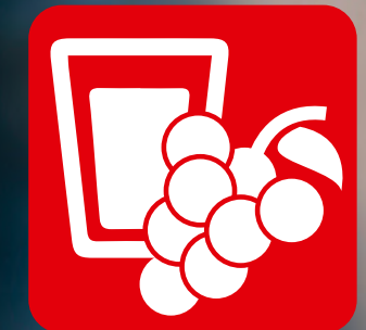
GETRÄNKE & OBST